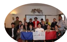
現在活動中の地域おこし協力隊（小柳夫婦）