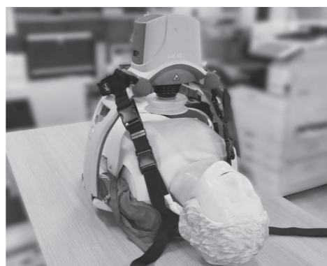
自動心臓マッサージ器（装着イメージ）