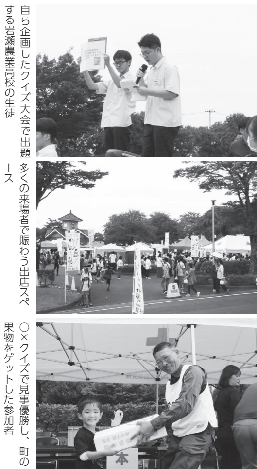
自ら企画したクイズ大会で出題する岩瀬農業高校の生徒

鏡石町を訪れ、町産のフルーツの生産現場を肌で感じ、その素晴らしさを伝えたいという思いが募りました。農家の方と触れあい、更に高まった想いを形にするために、フルーツが主役のスイーツを提供するカフェを期間限定でオープンします。町の皆さんに、made in kagamiishi フルーツの魅力を見つけていただければ幸いです。