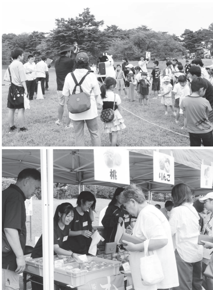
クイズを楽しむ参加者