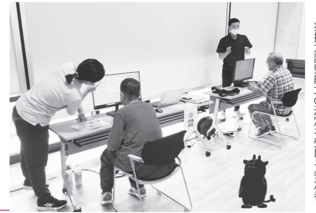
把握力調整能力の測定を受ける参加者

参加者は医大の先生、学生により健康に過ごすために必要な生活機能における体力測定を行い、測定後に医大の先生による分析結果の説明を受けました。