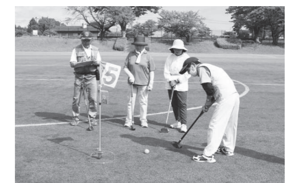
グラウンド・ゴルフ大会で真剣にプレイする参加者