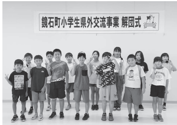
解団式に参加した子どもたち