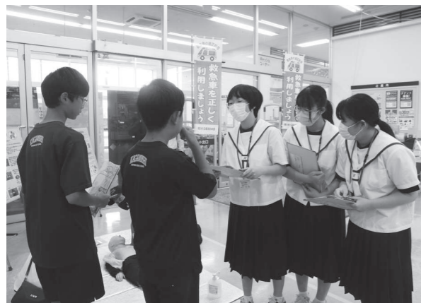
イオンスーパーセンター鏡石店で職場体験をしているところ取材する生徒