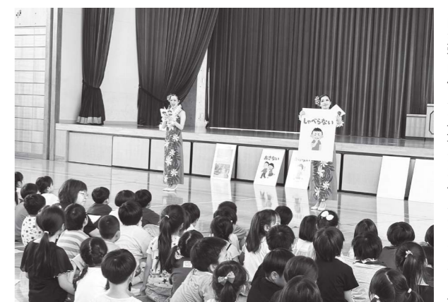
パネルなどを使いながら、自身の体験を基に災害に備える大切さを伝えるフラガール

フラガールは、東日本大震災やコロナ禍の当時の体験を基に、諦めない気持ちと仲間大切さ、普段から災害に備えることの大切さを子どもたちに伝えました。