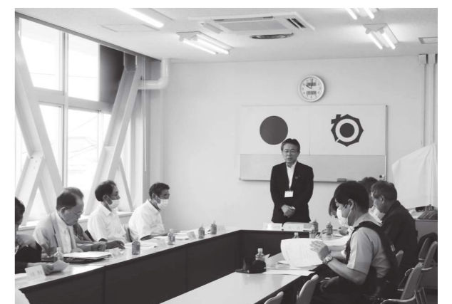
挨拶をする木賊町長

そのうち1件（久来石地内）は、町条例による緊急安全措置（危険箇所の撤去）の実施、その他2件の特定空家等について、空家特措法による処分の検討を決定しました。今後は、措置の実施に向けて手続きを進めていきます。