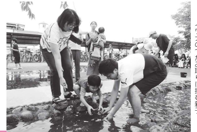
イワナのつかみ取りに挑む親子

当日は、1,800人を超える方々が、キッチンカーでの買い物やイワナのつかみ取りなどの催しを楽しみました。また、参加された皆さんの願いが書かれた短冊は、町図書館2階の田んぼアート観覧会場に飾られています。