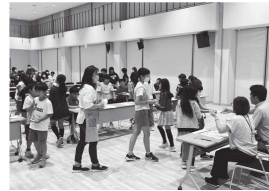
期待と緊張を胸に抽選のくじを引く子どもたち