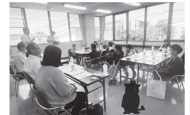
事前研修会で説明を受ける子どもたち

家族に勧められて応募しました。当選したときはすごく嬉しかったです！ 沖縄に行くのも、飛行機に乗るのも、家族と離れて行動するのも全部が初めてで、緊張もしていますが、すごく楽しみです。 特に楽しみなのは、美ら海水族館に見学に行きジンベイザメを見ることです。