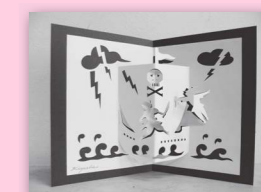
立体カード 「ピーターパンの冒険」