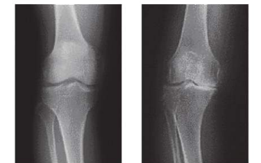
正常 変形性膝関節症 X線(レントゲン)写真 立位で撮影すると変形が、より明らかになる

痛みや腫れ、関節の動きの程度などを問診や直接触って検査するとともに、レントゲン検査で確認します(図を参照)。必要に応じてMRIなどの検査も行います。