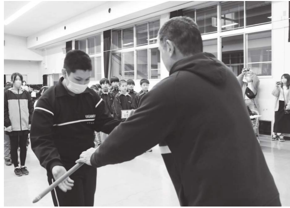
高原本部長から団旗を受ける団員