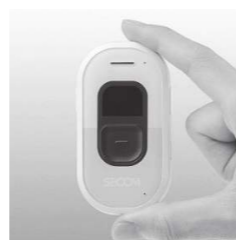
▲ GPS 端末機

認知症等により行方不明になる不安を感じている方へ「GPS 端末機 (居場所を知らせる装置)」を貸与し、対象の方に携帯してもらうことで、万が一行方不明になった時、オペレーションセンターやパソコンなどでおおよその位置を確認し、早期発見につなげることができます。