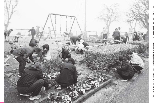
早朝から環境美化活動に取り組む皆さん

4月7日(日)、町内一斉環境美化活動が各地区で行われ、早朝から多くの町民が汗を流しました。この活動は、美しいまちづくりの一環として、町民みずからの手で町をきれいにすることを目的に、毎年4、6、8、10月の第1日曜日に自宅周辺や歩道、公園などの除草、捨てられたごみ拾いなどの清掃活動を実施しています。みんなで暮らしやすい快適な生活環境を作りましょう。