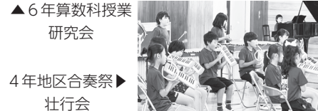
4年地区合奏祭▶ 壮行会