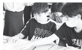
▲6年算数科授業研究会

忙しい毎日ですが、子どもたちは元気にがんばっています。いろいろな体験を通して、心豊かに成長していけるよう取り組んで参ります。