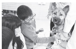
▲1年獣医師派遣授業