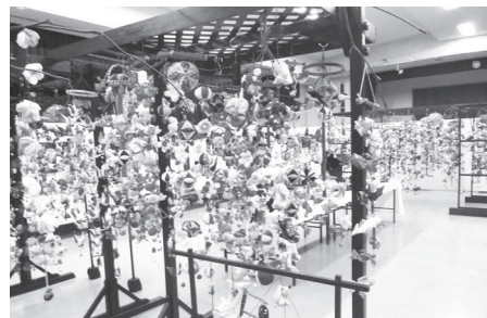
前回のつるしかざり展の様子