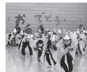
2年生によるダンス

また、5年生が中心となった実行委員会のてきぱきした動きやスムーズな運営も印象に残りました。