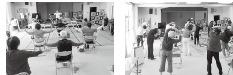
理学療法士の指導のもと、楽しく体を動かしています!