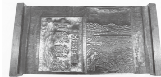
須賀川市立博物館に保管されている「磨光編版木」の一部

版木は、町内鏡沼の常松氏が所蔵していましたが、平成13年に須賀川博物館に寄託されました。その全文は「鏡石町史」第二巻に収録されていますが、その中の一部をご紹介します。