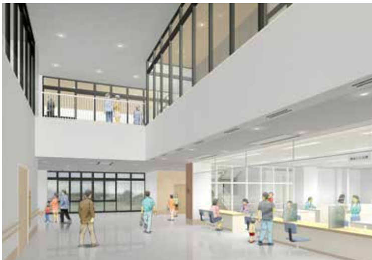
施設内のイメージ (エントランスホール)