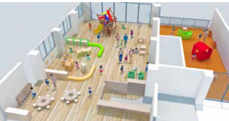
キッズスペースのイメージ