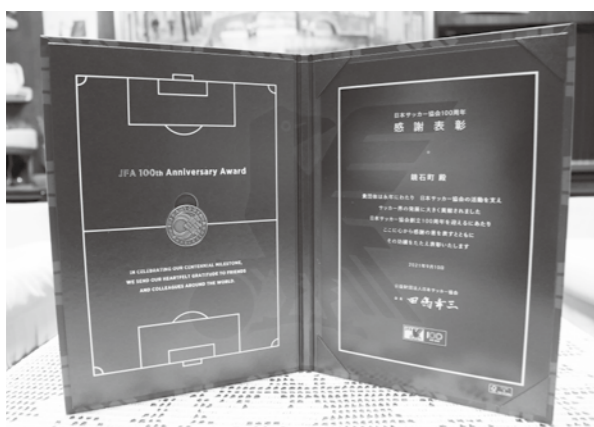
日本サッカー協会から贈られた表彰記念品

公民館で行われた展示部門では、各愛好団体による書道や絵画、生け花、押し花、手芸、写真などの力作が会場に並びました。また、囲碁大会は勤労青少年ホーム、将棋大会は老人福祉センターでそれぞれ行われ、参加者が盤上で熱い戦いを繰り広げていました。