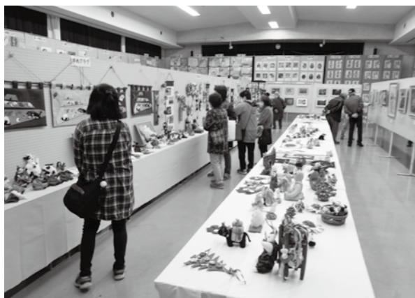
多彩な作品が並んだ「秋の文化祭」