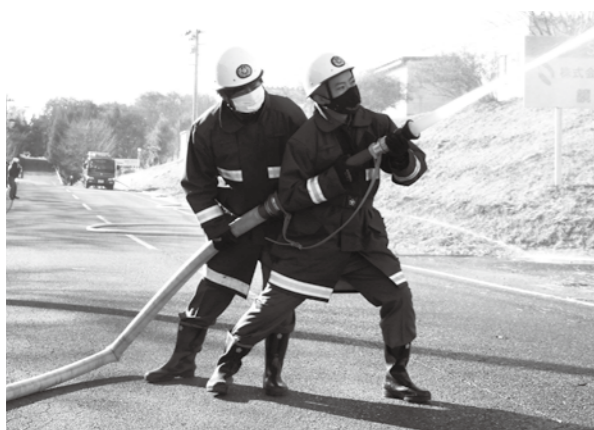
真剣な表情で訓練に臨む団員ら

この表彰は、日本サッカー界に助成や支援、協力を行った個人、団体に贈られるもので、鏡石町は平成26年に鳥見山公園多目的広場にサッカー多目的用のロングパイル人工芝を導入し、競技環境の整備に貢献したことなどが評価され、今回の受賞となりました。