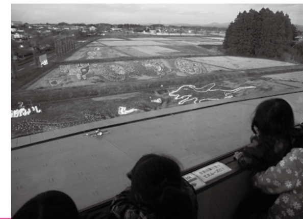
きらきらアートを眺める鏡石保育所の子どもたち

来年1月10日(月・祝)まで町図書館4階展望室から観覧することができます。観覧時間は16時30分～18時45分まで、毎週月曜日及び12月27日(月)～1月4日(火)の期間は休館となります。夏とは違った幻想的な田んぼアートをぜひご覧ください。