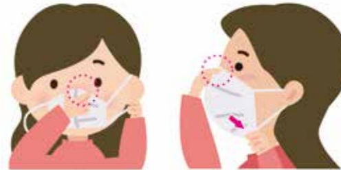
①鼻の形に合わせ、すき間をふさぐ ②あご下まで伸ばし、顔にすき間なくフィットさせる

マスクを着用しても、鼻を出していたり、あごにかけている効果はありません。マスクは正しく着用し、着けた後はマスクの外側は触らないようにして、ひもを持って着脱しましょう。できれば品質の確かな、不織布のものを使用しましょう。