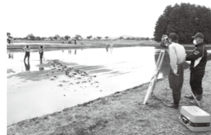
岩瀬農業高校、鏡石建設業協同組合の皆さんと測量を行いました

田んぼアートは6月中旬から鏡石町図書館4階展望室で観覧可能となり、7月上旬から8月に見ごろを迎えます。観覧開始日は後日、町ホームページ等でお知らせします。