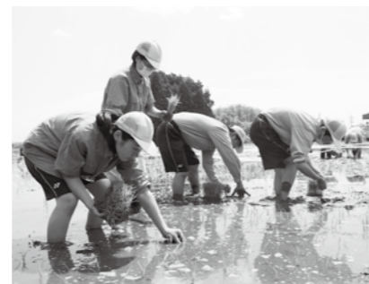
田植えには関係団体の皆さんが参加し、一つ一つ丁寧に苗を植えていきました

●問い合わせ先 かがみいし田んぼアート実行委員会（町産業課内） ☎ 62-2118