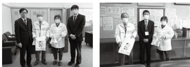
鏡石一小（写真左）と鏡石二小（写真右）に啓発グッズを贈呈

4月6日～15日の春の全国交通安全運動に合わせ、町交通安全協会と町交通安全母の会が啓発活動を行い、運転手や同乗者にシートベルトの着用徹底を呼び掛けました。