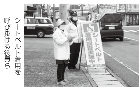
シートベルト着用を呼び掛ける役員ら