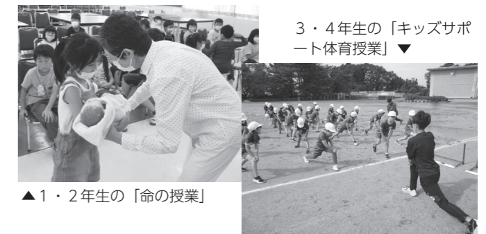
▲1・2年生の「命の授業」

土曜授業ということもあり、この日はゲストティーチャーズデーとして、各学年で外部の講師をお招きして授業を行いました。1・2年生は「命の授業」、3・4年生は「キッズサポート体育授業」、5年生は「新聞学習」、6年生は「消費生活出前講座」でした。専門的な方の授業は、大変勉強になります。