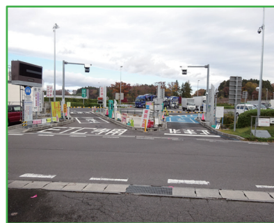
上り側 ETC ゲート改修