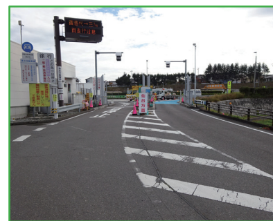
下り側 ETC ゲート改修