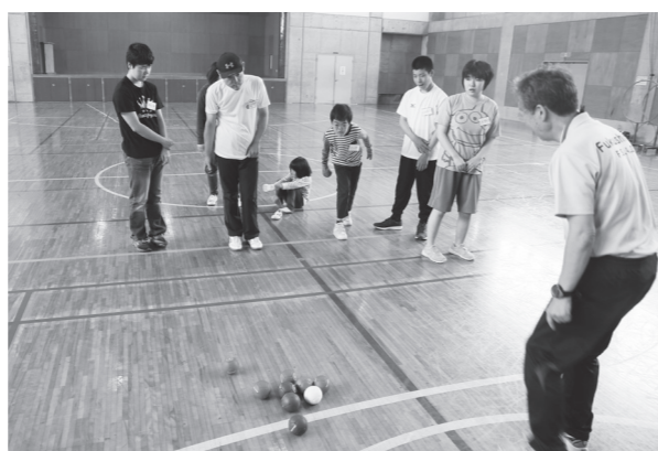
ボッチャを楽しむ参加者