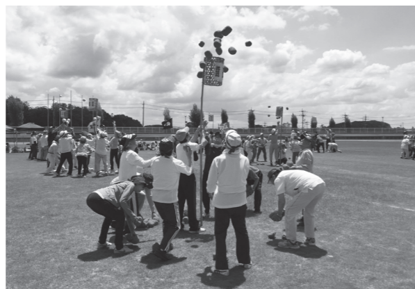
チーム一丸で取り組んだ玉入れ競技

結果は、優勝がさかい寿会、準優勝が豊郷長寿会、3位が笠石福寿会、第4位が成田成宝会でした。