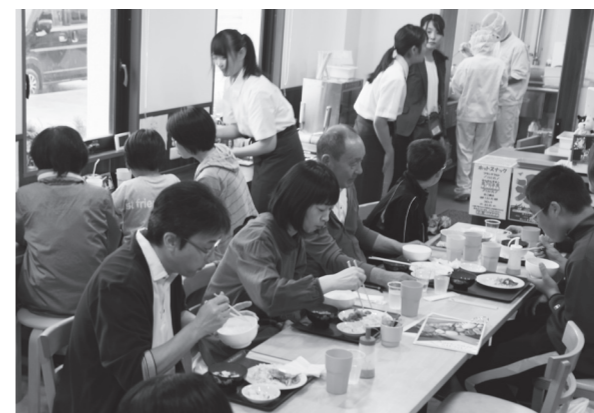
大盛況となった「力農カフェ」

優勝した両チームは、9月15日(日)に郡山地区で開催される県中地域大会に出場します。