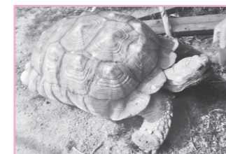
リクガメの リクたん