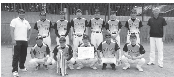
▶家庭バレーボールで優勝した「みんと」 ▶壮年ソフトボールで優勝した「ドラゴンズ」