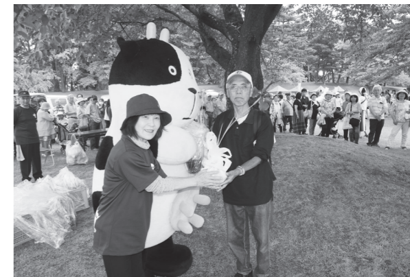
あやめ株のプレゼントでは来場者が長い列を作っていました

また、あやめ株式会社の皆さんによる恒例のあやめ株のプレゼントも行われ、会場には長蛇の列ができていました。