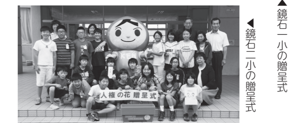
▲鏡石一小の贈呈式 ▲鏡石二小の贈呈式