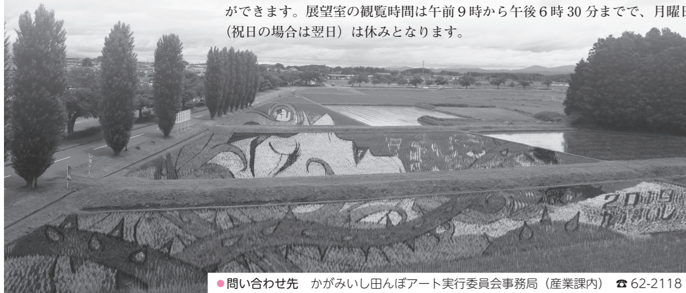
●問い合わせ先 かがみいし田んぼアート実行委員会事務局(産業課内) ☎62-2118