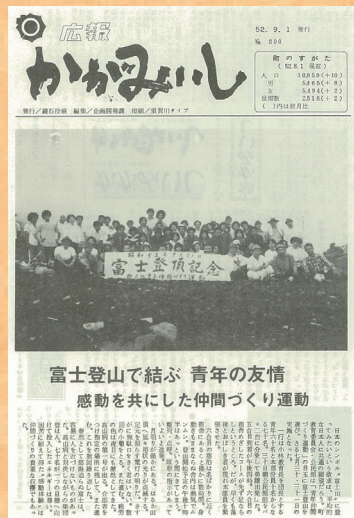
第200号 (昭和52年9月発行)