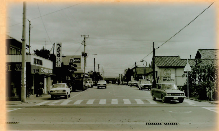
▲役場前の交差点。奥は鏡石駅 (昭和48年撮影)