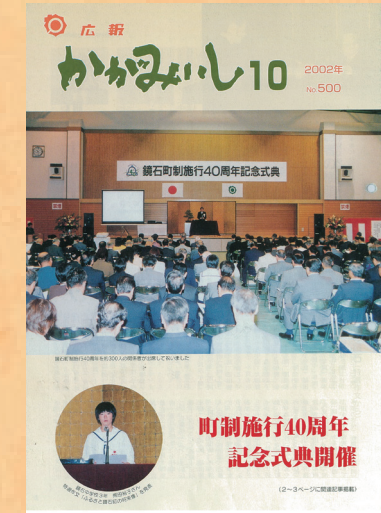
第500号 (平成14年10月発行)