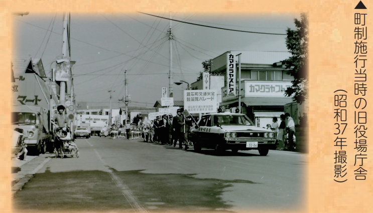
▲本町通りでの交通安全鼓笛パレード (昭和53年撮影)