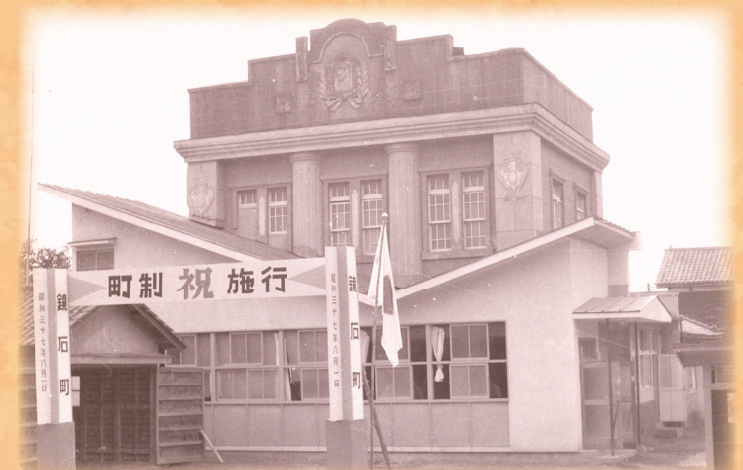
▲町制施行当時の旧役場庁舎 (昭和37年撮影)