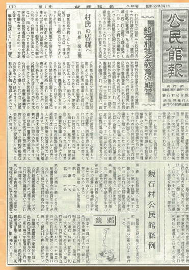
創刊号 (昭和27年8月発行)

町広報紙「広報かがみいし」は、読者の皆様に支えられ、今月で700号の節目を迎えることができました。広報かがみいしは、昭和27年8月に「公民館報」として発刊されたのが始まりで、当時は今よりも小さいB5判の紙面でした。昭和31年には活字印刷となり、翌32年には初めて広報紙の中に写真が登場しました。以降、広報かがみいしは時代の移り変わりとともに形を変えながら「鏡石の今」を伝え続けています。今月号では、昭和時代の懐かしい町内の風景写真や歴代の広報紙をご紹介しながら、鏡石町の歴史を振り返ります。昭和、平成を経て令和を迎えたこれからも広報かがみいしをよろしくお願いたします。