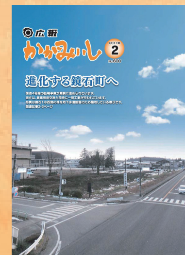
第600号 (平成23年2月発行)