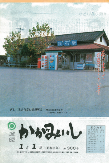
第300号 (昭和61年1月発行)