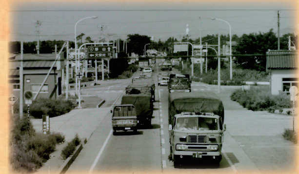
▲国道4号線の様子。奥は郡山方面 (昭和48年撮影)