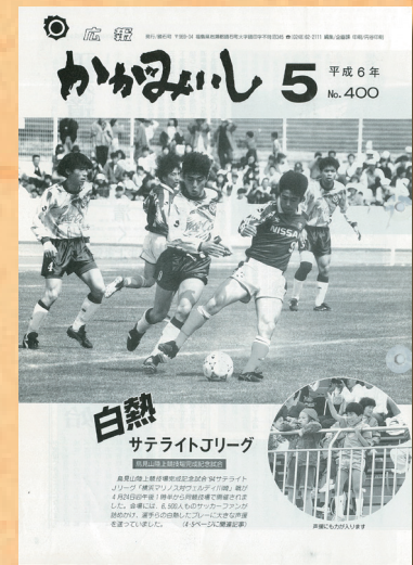
第400号 (平成6年5月発行)