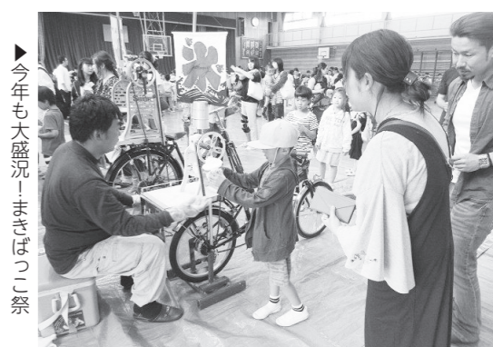
▶ 今年も大盛況！まきばっこ祭

つづいて3校時は、学習会と学級懇談会が実施され、その後、PTA・体育文化後援会主催の「まきばっこ祭」がありました。「まきばっこ祭」では、体育館でバザーと模擬店が開かれ、多くの人で賑わいました。