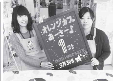
お気軽にお越しください♪

今回の オレンジカフェ あーさー♪ 【日時】 3月30日(金) 10時～12時 【場所】 ウエルシア岩瀬鏡石店