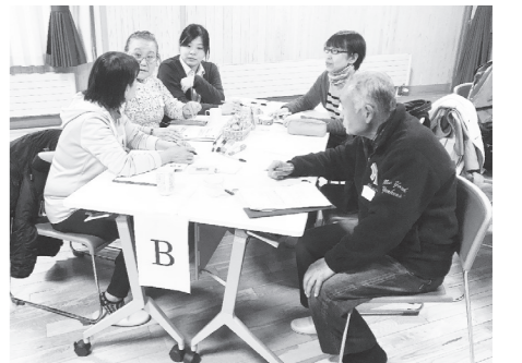
まちづくり勉強会の様子

認知症の人や その家族への支援 オレンジカフェあーさー♪ 毎月最終金曜日の午前10時から、ウエルシア岩瀬鏡石店で「オレンジカフェあーさー♪」を開催しています。認知症の人やその家族はもちろん、地域にお住まいの方、元気な高齢者の方など、どなたでもお越しいただける集いの場です。お茶やコーヒーを飲みながら楽しい会話やゲームに参加してみませんか? オレンジカフェあーさー♪は、昨年3月に開店し、今月で1周年を迎えることができました。これもひとえにご来