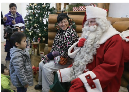
若瀬牧場にサンタクロースがやってきました