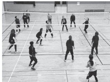
バレーボール大会