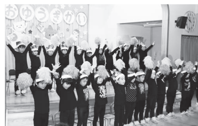
鏡石保育所おゆうぎ会「歩いて帰ろう(ラインダンス)」

12月2日(土)には鏡石幼稚園で生活発表会が、12月9日(土)には鏡石保育所でおゆうぎ会が開催されました。子どもたちは、劇やダンスなど、練習の成果を発表し、成長した姿を保護者の皆さんに披露していました。