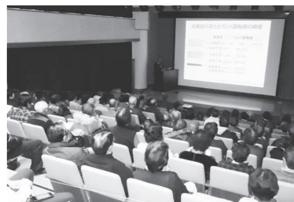
セミナーには多くの町民が参加しました