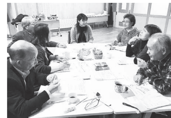
和気あいあいと情報交換を行う参加者

第3回勉強会は1月25日(水)に開催されます。興味のある方は、福祉こども課(☎62-2210)までお問い合わせください。