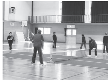
バウンドテニス大会