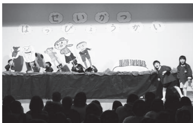
鏡石幼稚園生活発表会「おおきなカブ(紙人形劇)」