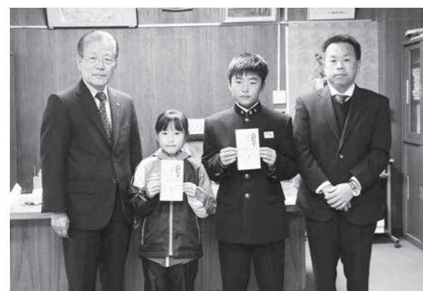
出場を報告した碧音さん(中央右)と愛梨さん(中央左)