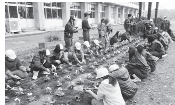
二小の花壇にパンジーを植える参加者

なおこの事業は、鏡石中学校とも行われ、10月6日(金)に中学生30名が本校で各学科の学習内容を体験しました。