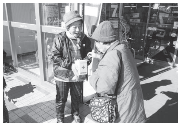
協力を呼びかける団員

活動では、店舗の街頭で利用者に募金への協力をお願いし、18,466円のご協力をいただきました。集められた寄付金は、海外で赤十字が行う国際救援・開発協力を活用されます。