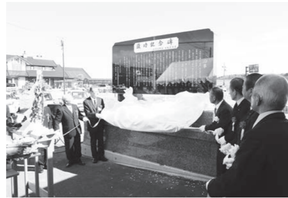
記念碑を除幕する関係者

終了後には鏡石館で記念式典が行われ、関係者約70人が出席し、事業経過報告や県知事からの感謝状贈呈などが行われました。