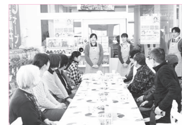
3月28日頃のプレオープンで挨拶するスタッフ

「オレンジカフェあーさー」は、認知症になっても住み慣れた町で安心して生活していくことができるように、認知症についての正しい知識の普及や、地域のつながりを深めることを目指して行うもので、町が地域包括支援センター「あんしんかん」に委託して実施します。