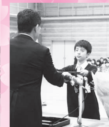
第二小学校 卒業生 27名