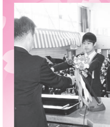
第一小学校 卒業生 115名

卒業おめでとう 春は旅立ちの季節です。町内の各小・中学校、幼稚園、保育所で卒業・卒園・満了式が行われ、子どもたちは大きな希望と小さな不安を胸に新天地へと旅立ちました。保護者や先生方は子どもたちの成長に感動するとともに、これから子どもたちが今以上に頼もしく成長する姿を想像しながら、見送りました。