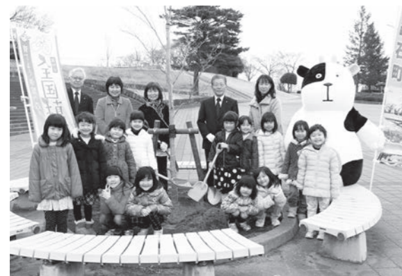
鏡石保育所の子どもたちと関係者で集合写真