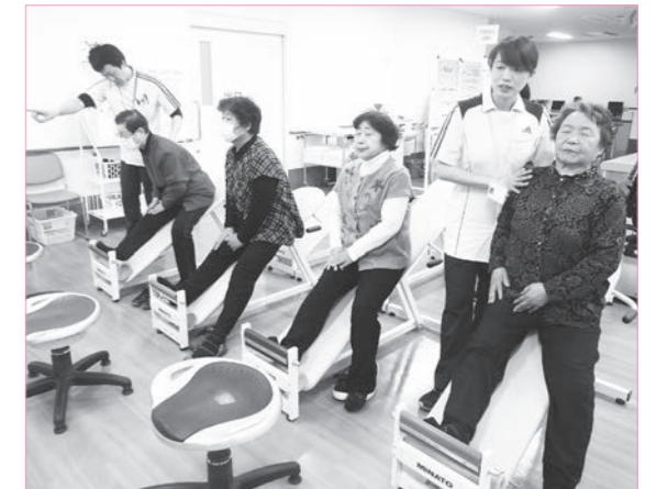
指導を受けながら運動に取り組む参加者

「家のお風呂をまたぐのが大変になってきた」「よくつまづくようになった」「歩くのもおっくうで買い物に行くのも大変になってきた」こんな心当たりはありませんか？「けんこう貯筋教室」に参加して、体力づくりに取組みましょう。ご興味のある方は、福祉こども課または地域包括支援センター「あんしんかん」にご相談ください。