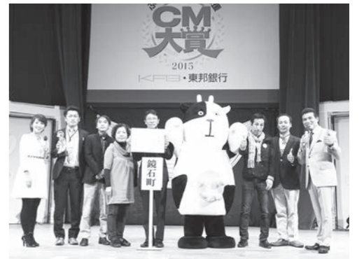
「ぶくしまの元気」応援CM大賞 2015 大賞受賞

これまで、町公式キャラクター「牧場のあーさー」の決定やふるさとCM大賞への参加、お宝マップの作成など