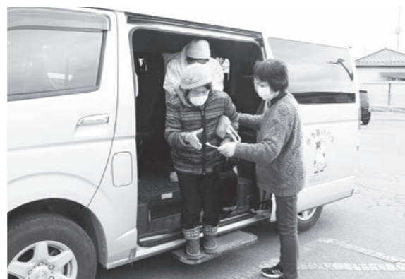
買い物先で降車する利用者