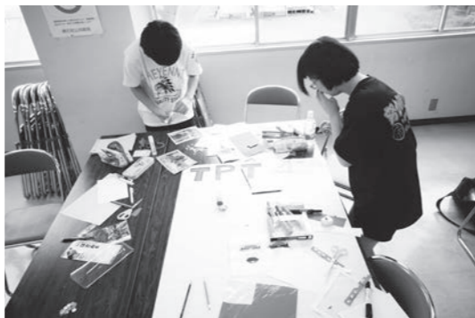
9月に公民館でTPT新聞作りをする様子