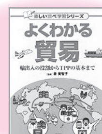
「よくわかる貿易」 PHP研究所 泉 美智子：監修

港町に、かもめが経営する宅配便屋さんがありました。ところが、この宅配便さんはあまりにも忙しくて、やめてしまうかもめがたくさんいました。かもめ店長さんは、長く働いてくれるかもめはいないか、と悩んでいました。そんなある日、配達員の募集に応募された一枚の写真に、きりりとした厳しい顔を見つけて、こいつは長続きするにちがいない！と喜んだ店長さんでしたが、いざ、応募した新人配達員がきてみると…。