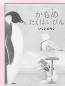
「かもめ たくはいびん」 白泉社 いしい ひろし：著

港町に、かもめが経営する宅配便屋さんがありました。ところが、この宅配便さんはあまりにも忙しくて、やめてしまうかもめがたくさんいました。かもめ店長さんは、長く働いてくれるかもめはいないか、と悩んでいました。そんなある日、配達員の募集に応募された一枚の写真に、きりりとした厳しい顔を見つけて、こいつは長続きするにちがいない！と喜んだ店長さんでしたが、いざ、応募した新人配達員がきてみると…。