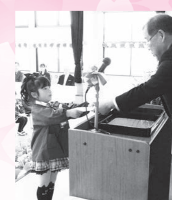
鏡石幼稚園 卒園児 34名