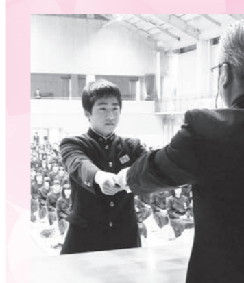
鏡石中学校 卒業生 138名