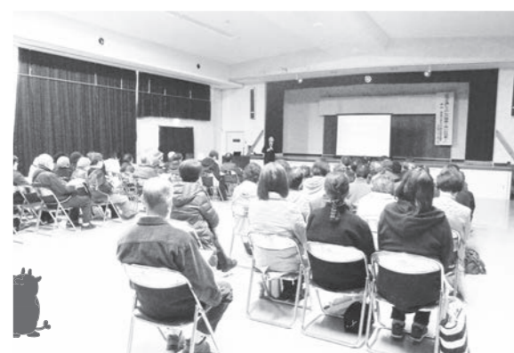
大平先生の話熱心に聴く参加者