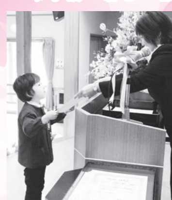
鏡石保育所 満了児 29名