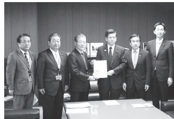
石井大臣に要望書を手渡す遠藤町長

10月28日(金)、遠藤町長と渡辺定己町議会議長、菊地洋町議会議長、総務文教常任委員長が国土交通省を訪ね、石井啓一国土交通大臣に要望活動を行いました。要望内容は次の3つです。①国道4号線の鏡石区間6kmのうち事業区間4.5kmの早期完成と残り区間1.5kmと以南の矢吹町、泉崎村区間の事業計画決定について ②既存の土地区画整理事業用地への避難者受け入れのための復興交付金と社会資本総合整備交付金の拡充について ③鏡石スマートICの利用車種拡大について(6mから9mへ)