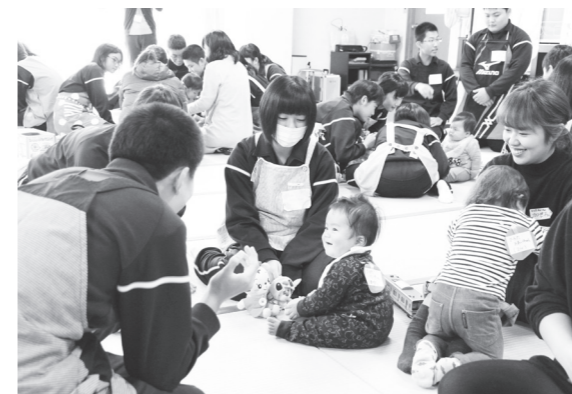
「いないいないばあ〜」で幼児をあやす生徒(左)

11月10日(木)、11日(金)、17日(土)の3日間、町老人福祉センターで、中学校3年生の家庭科の授業として「幼児とのふれあい体験授業」が実施されました。参加した生徒の皆さんは、保護者の方から育児の大変さや子育ての喜びなどについて話を聞いたり、実際に幼児とふれあったりしながら、子育てや家族、家庭について関心を深めていました。慣れない幼児とのふれあいに最初は緊張していた生徒の皆さんも、徐々に慣れ、楽しくふれあっていました。