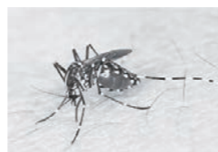
【ヒトスジシマカ】 背中に1本の白い線とW字状の模様がある4.5mm程の蚊。5月から10月頃に活動する。

公園にさえ注意しておけばいいと思われがちですが、公園以外にも、雨ざらしの用具、雨除けのブルーシートや古タイヤに溜まった水たまり、風通しの悪いやぶ・草むら、植木鉢の皿、屋外に放置された空きビン・缶・ペットボトル、雨水升や排水升なども発生源となります。