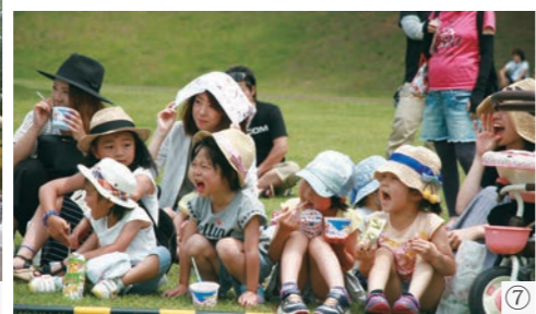
①約80人が参加した「あやめウォーク」 ②あやめ株式会社による「あやめの株プレゼント」。今年も大勢の方が並びました ③出店コーナーでは今年も自転車かき氷が登場。お父さん、がんばって漕いでいます ④関係者と子ども達によるテープカット ⑤バルーンパフォーマンスも好評です ⑥風船もらって嬉しいな ⑦バルーンのおねえさんがんばれー ⑧よさこい楽しいね ⑨鏡石幼稚園・鏡石保育所・鏡踊爛會による全員でのよさこい総踊り