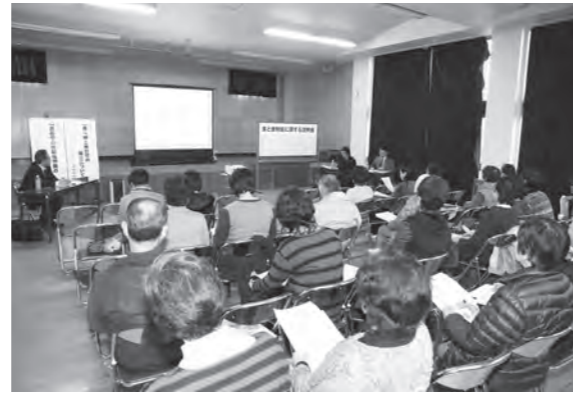
食への正しい知識を学びます

放射能は元々食べ物自体にも含まれており、気をつけるべき品目は判明していることが説明され、参加者は説明を聞き驚いている様子でした。東日本大震災の発生により、食に対する安全・安心への関心が高まっており、正しい知識を習得することが大切です。