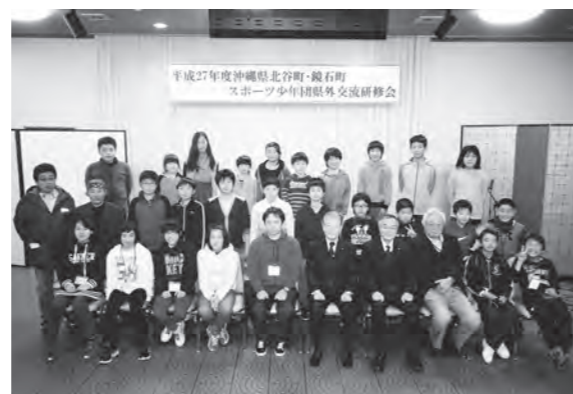
参加者全員で親睦を深めました

2月13日(出)から15日(月)までの3日間、沖縄県北谷町・鏡石町スポーツ少年団県外交流研修会が開催されました。北谷町からは10人の子どもたちが参加し、町の子供たちとスポーツ交流や食事会等で親睦を深めました。また、ホームステイも行われ沖縄と福島の暮らしの違いを肌で感じることができ、参加した児童からは「ホームステイ先の皆さんがとても優しく嬉しかったです。また、力を合わせれば何でもできることを学びました」と話がありました。