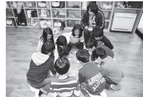
かるたはどこにあるのかな～？

2月4日(休)鏡石幼稚園において、食育教室が行われました。風邪をひかないためにはどのような食べ物を食べたらよいか、食べたものはどのように体外に排出されるのか学びました。甘い食べ物や、カップ麺をたくさん食べると太り風邪をひきやすくなるため、緑黄色野菜・肉・魚・牛乳などを良く噛んで食べるよう説明があり、食べ物が体外に排出されるには、小腸を通ることを同じ長さで作られた模型を園児たちは手にとり実感しました。