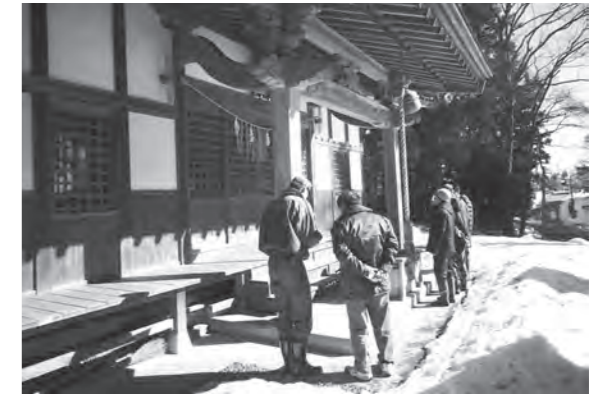
町内の文化財や寺社の状況を確認している様子

この査察は町内の文化財及び寺社について文化財の保護と防火対策の強化に努めることを目的として行われており、環境の整備や文化財の管理、施設管理状況などを確認しました。