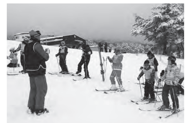
講師の方の説明を聞きスキーの練習をする様子

参加者の子どもたちは初めてスキーに挑戦する子も多く、立つことも大変でしたが、午後になると徐々に慣れ滑れるようになりました。子どもたちの中には、転びながらも楽しそうに練習している姿や、怖がりながらも頑張っている姿が見られました。