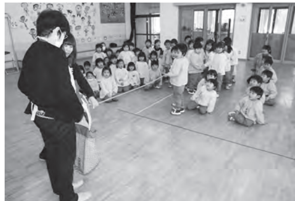
小腸がどのくらい長いのか見てみよう