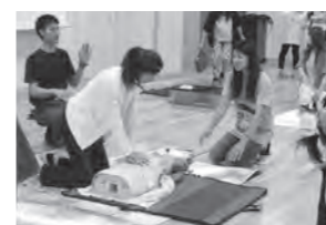
救命救急法講習会

また、1学年保護者の方を対象に「救命救急法講習会」をあやめホールにて行いました。須賀川消防署鏡石分署の方を講師に迎え、心肺蘇生法やAEDの使い方などの講習を受けました。初めて経験する方が多く戸惑いながらの講習でしたが、講師の先生に熱心に質問するなど、皆さん真剣に講習に参加していました。