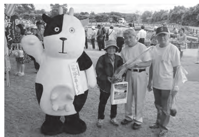
あやめ株をプレゼント