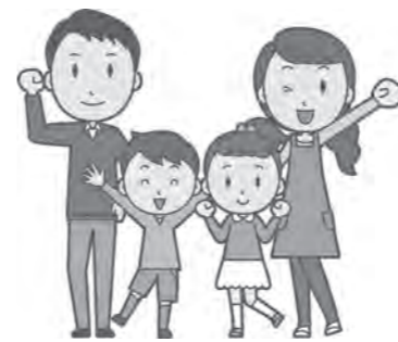
別表1：国保税率の改正内容

医療費が増えれば国保の財政が厳しくなり、納めていただく国保税も増えることとなります。町の特健診などを積極的に受診するなどして早期発見、早期治療に努めるとともに、ジェネリック医薬品など、ご協力をお願いします。