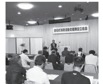
支援隊設立総会の様子