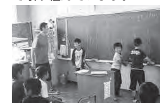
英語の活動や授業の様子