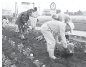
花いっぱい運動の様子