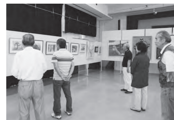
展示された作品を鑑賞する来場者