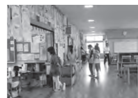
フリー参観の様子