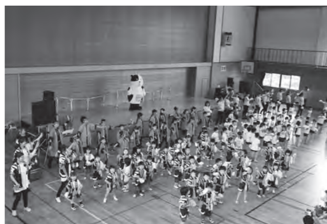
オープニングを飾ったよさこい総踊り

同時開催された「あやめウォーク」には関東方面からの参加者もあり約150人が、鳥見山公園、田んぼアート、岩瀬牧場などウォーキングで汗を流しました。