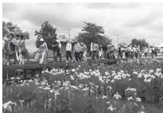
多くの方に参加いただいた「あやめウォーク」