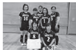
家庭バレーボール優勝「みんと」