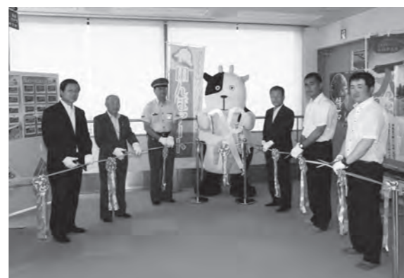
観覧場所の図書館4階で行われたテープカット

今年の絵柄は浦島太郎を観光客に見立て、「牧場のあーさー」がお出迎えする形となっており、「かがみいし WELCOME ふくしまDC」の文字には、鏡石町はもとより、県外から訪れる方へのおもてなしの思いが込められています。見頃は7月～8月頃です。