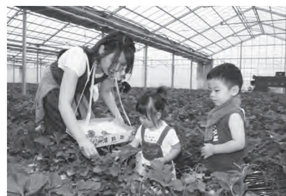
イチゴ狩りを親子で楽しみました