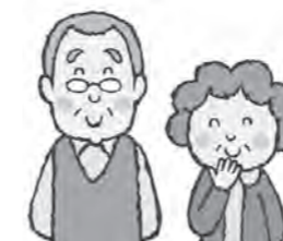
別表2：軽減判定所得の見直し内容

国保を円滑に運営するためには国保税の納期限内の納付が重要です。国保税を納めないとい「短期保険証」や医療費を一度全額自己負担しなければならぬ「資格証明書」が発行されることとなります。国保税の納付が困難な方は滞納額が増えないよう必ず税務町民課までご相談ください。