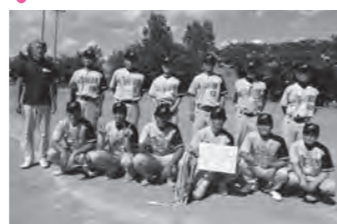
壮年ソフトボール優勝「ドラゴンズ」