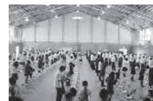
農業鑑定競技大会