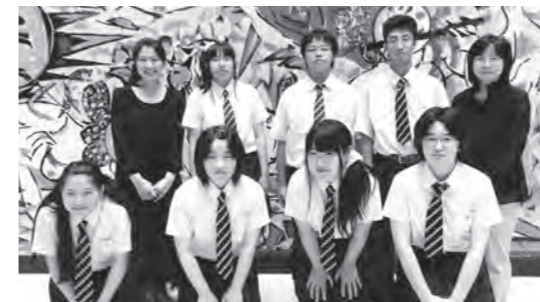
本校の合唱部メンバー