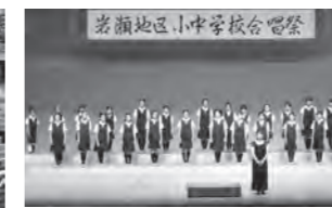
地区合唱祭に出場した合唱部