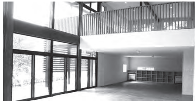
南面採光により吹き抜けになっている1階交流室