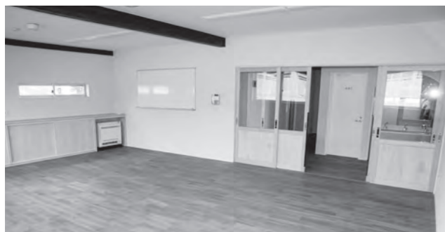
他室と独立した静かな環境のクラブ室（勉強室）