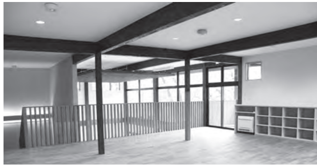
1階交流室との吹き抜けにより風通しの良い2階交流室