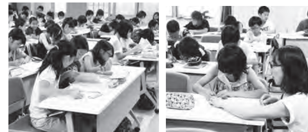
みんなで勉強しよう（6年生） 学校応援団の方にご協力いただきました

予想していたよりも多くの児童が参加し、一生懸命学習してくれていたのが、良い生活リズムを作ることができたと思っております。