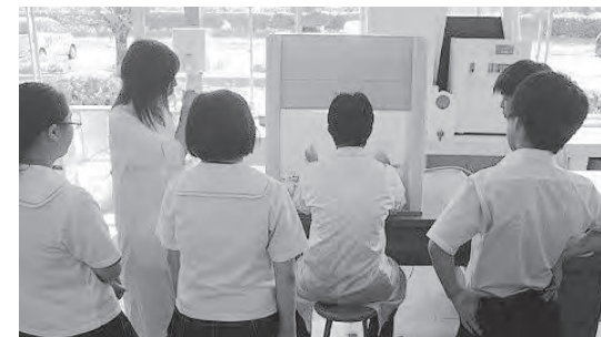
体験入学では受験生に各学科について説明しました

本校では、各学科の特徴を生かした学習を実施しています。7月29日(火)には中学生一日体験入学が実施され、多くの受験生が来校されました。