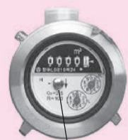
パイロットをチェック