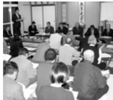
鏡石一区の町政懇談会

町と各行政区が主催する町政懇談会が11月14日(月)から3日間開催されました。懇談会は、町民の意見・要望を聞いてまちづくりに生かすため実施されているもので、今年は、さかい区、鏡石1区、鏡田区の3行政区で行われ50名が参加しました。懇談会では、質疑や意見交換を行い、参加者は熱心に質問を投げかけていました。