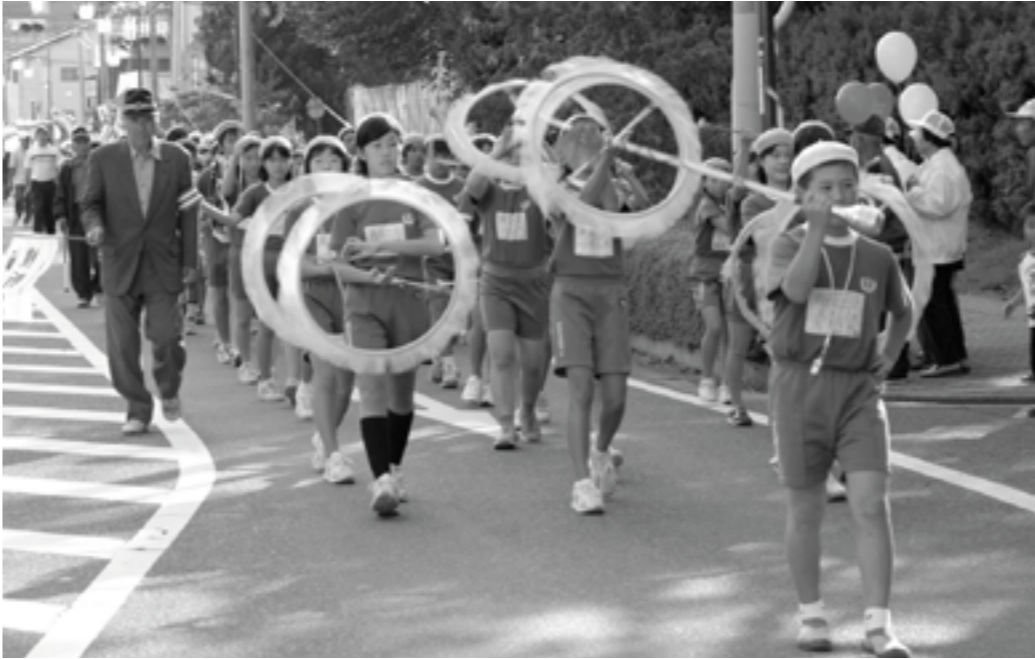
交通安全を訴えた鼓笛隊パレード(鏡石一小)

年末年始の何かとあわただしい時期を迎え、交通事故の多発が予想されます。この時期は、交通渋滞や積雪・凍結などにより道路環境が悪化し、また、忘年会、新年会などでお酒を飲む機会が多くなることから飲酒運転による重大事故も発生しています。12月10日(土)から来年の1月7日(土)までの間、「年末年始の県民総ぐるみ運動」が実施されますので町内から悲惨な事故を起こさないように注意し、よいお正月を迎えましょう。