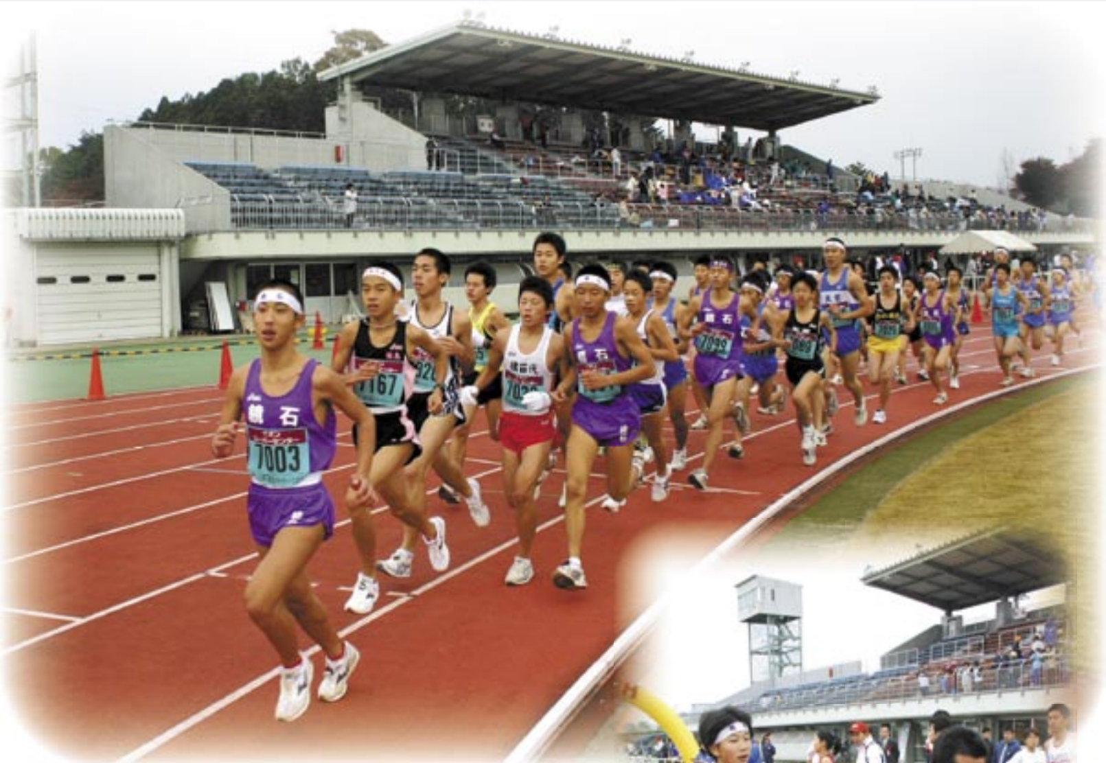
健脚を競った第1回鏡石駅伝ロードレース大会