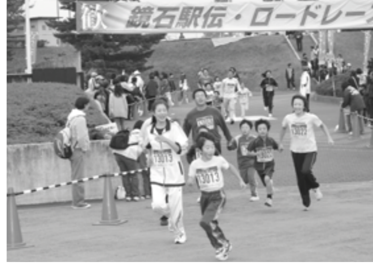
全力疾走するランナー

5地区のライオンズクラブでは、11月21日(月)午前11時から高野池前で白鳥の餌の贈呈式を行いました。式では、各クラブから木賊町長に、くず米や購入資金が贈られ、続いて木賊町長から感謝状が手渡されました。町では、今年も白鳥の餌を募集しています。詳しくは、町産業課(☎62-2118)までお問い合わせください。