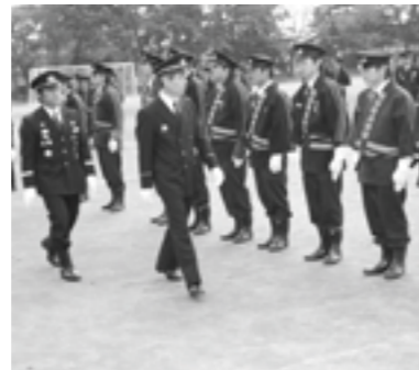
通常点検を受ける団員のみなさん

町消防団では、10月30日(日)午前9時から鏡石中学校校庭で、消防団員と女性消防隊員約130名が参加し、秋季検閲式を開催しました。式では、優良消防団員と消防協力者へ表彰が行われました。その後、木賊町長などが通常点検、機械器具点検を行った後、消防団員による中隊訓練および分列行進が披露されました。