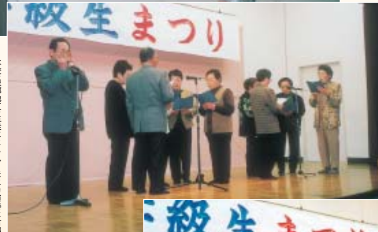
本校豊郷地区生徒によるハーモニカ演奏と合唱