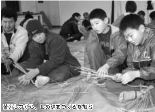
苦労しながら、しめ縄をつくる参加者

町子ども会育成会連絡協議会では、高齢者との世代間の交流を深めるとともに、子ども達の創作心の向上を図るため、12月23日(火)午前9時30分から、町公民館で創作教室を開催しました。