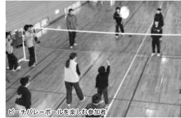
ビーチバレーボールを楽しむ参加者

2 5 第5回子ども会ウインターカップ大会が、12月14日(日)、午前9時から町鳥見山体育館で開催されました。 当日は、各行政区から親子や友達で編成した30チーム、123人が参加し、ビーチバレーボールでブロック別にリーグ戦を行いました。優勝チームは、次のとおりです。 Aブロック 1区Aチーム Bブロック 鈴木ファミリートーム Cブロック 向坪チーム Dブロック ドリームチーム Eブロック 古川チーム Fブロック 3区Aチーム