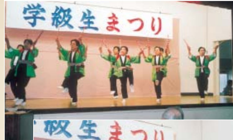
鏡田分校生徒による舞踊「日光和楽」