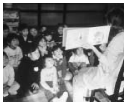
絵本の世界に入り込む園児たち

今回の、わたしたちのがっこうシリーズは、初登場の鏡石栄光幼稚園を紹介します。鏡石栄光幼稚園は栄光学園に属し、栄光幼稚園、愛星幼稚園(どちらも須賀川)とは姉妹園となっています。現在、3歳児から5歳児まで、28名の園児が楽しく生活を送っています。 「遊び」を楽しむ環境作り 朝、元気一杯に登園すると大好きな友達や先生に迎えられる一日が始まります。保育室は、園児達のがのびのびと遊びの時間を楽しめるよう環境作りをしています。「ままごと」、「積み木」、「お絵描き」などのコーナーがあり、園児達は、居心地の良い場所を見つけて遊んでいます。 自発的な遊びの中で、自分の思いを伝えたり、相手の気持ちを受け止めたりしながら、年齢の違う友達や先生と交流することで様々な体験をしています。 絵本の世界で感性を豊かに 園での生活の中で、絵本の読み聞かせの時間を大切にしています。園児達は、先生の愛情たっぷりの声で絵本を読んでもらうのを楽しみにしています。絵本が開かれると、