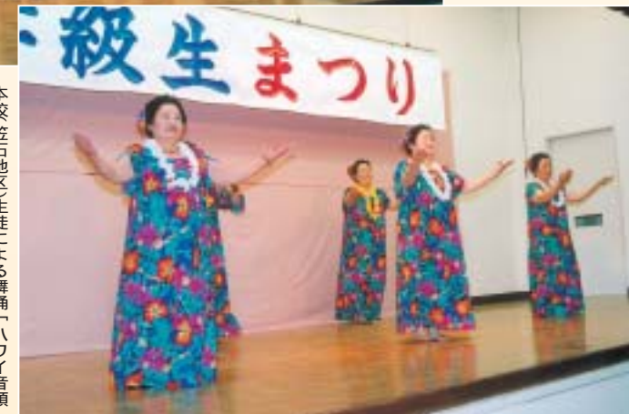
本校笠石地区(生徒)による舞踊「ハワイ音頭」