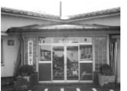
鏡石保健センター

いることから、今年度、町では、定員を115人から140人に増員しましたが、12月現在では、定員を超える151人が入所しており、待機児童も14人を数えております。このような状況から、待機児童を解消し、小さいお子さんを持つ親が、安心して仕事ができる環境を整えるため、現在の鏡石保健センターを改修して、保育所分園を設置する予定です。 その他、笠石の側溝補修工事費に700万円の増額、鳥