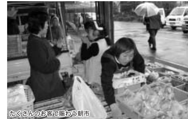
たくさんのお客で賑わう朝市

1 新鮮な野菜・果物を販売 朝市を開催 町の農家などで構成する町朝市友の会では、町の農家が育てた野菜や果物をたくさんの方に味わってもらうため、11月30日(日)、午前8時から町役場駐車場での朝市を開催しました。 当日は、農産物直売所あやめをはじめ8つの農家・団体が出品し、新鮮な白菜・大根や採れたてのりんごなど、新鮮な野菜・果物を販売しました。 小雨が降りしきるあいにくの天気でしたが、朝早くから、多くの方が来場し、お目当ての商品を買い求めていました。