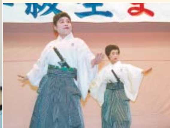
1年間の練習の成果を披露