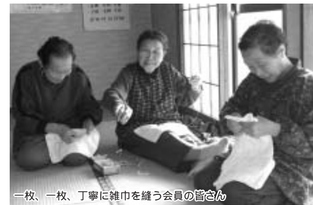
一枚、一枚、丁寧に雑巾を縫う会員の皆さん

4 心をこめて雑巾を縫う 鏡石老人クラブで雑巾づくり 老人クラブ鏡石長寿会では、12月14日(日)、午前9時から鏡石製作センターで雑巾づくりを行いました。 毎年この時期に行っているもので、会員約30名が参加し、自宅から持ってきたタオルを一枚一枚、手で縫ってたくさん雑巾をつくりました。 完成した雑巾は、町老人クラブ連合会が、他の老人クラブでつくったものといっしょに集め、町内の学校、幼稚園、保育所、児童館、鏡石ホームなどにプレゼントするそうです。