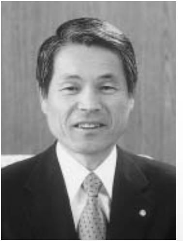
鏡石町長 木賊政雄