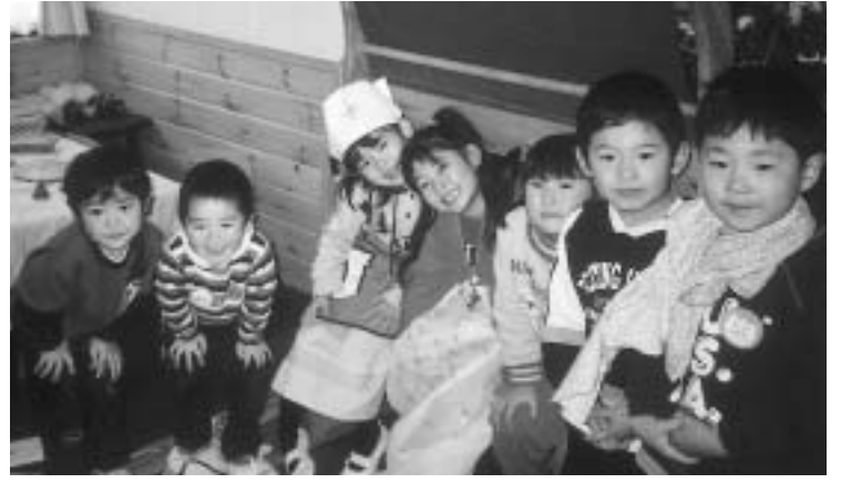
のびのび遊ぶ園児達

今回の、わたしたちのがっこうシリーズは、初登場の鏡石栄光幼稚園を紹介します。鏡石栄光幼稚園は栄光学園に属し、栄光幼稚園、愛星幼稚園(どちらも須賀川)とは姉妹園となっています。現在、3歳児から5歳児まで、28名の園児が楽しく生活を送っています。 「遊び」を楽しむ環境作り 朝、元気一杯に登園すると大好きな友達や先生に迎えられる一日が始まります。保育室は、園児達のがのびのびと遊びの時間を楽しめるよう環境作りをしています。「ままごと」、「積み木」、「お絵描き」などのコーナーがあり、園児達は、居心地の良い場所を見つけて遊んでいます。 自発的な遊びの中で、自分の思いを伝えたり、相手の気持ちを受け止めたりしながら、年齢の違う友達や先生と交流することで様々な体験をしています。 絵本の世界で感性を豊かに 園での生活の中で、絵本の読み聞かせの時間を大切にしています。園児達は、先生の愛情たっぷりの声で絵本を読んでもらうのを楽しみにしています。絵本が開かれると、