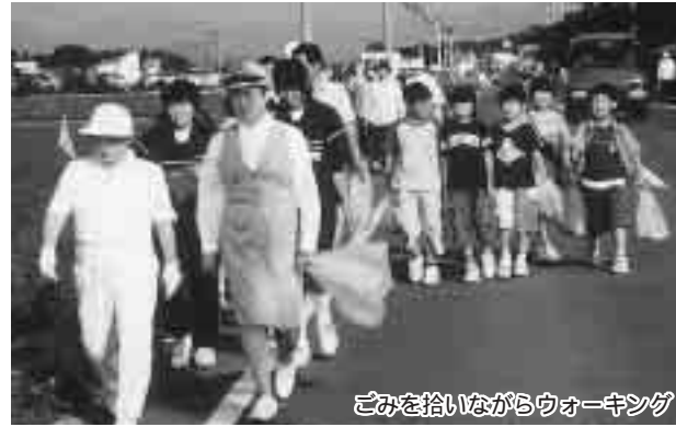
ごみを拾いながらウォーキング

親子がウォーキングやレクリエーションをとおしてふれ合いを深めることを目的に、町と町青少年育成町民会議が主催する第16回ファミリーふれあいウォーキングが、7月5日(土)、朝6時から開催されました。当日は、朝早くから、約200人の町民が町役場に集合し、開会式と準備運動を行った後、3つのコースに別れ、途中、道端におちている空き缶などのごみを拾いながら鳥見山競技場を目指しました。到着後は、レクリエーション(太極拳)を行い、さわやかな朝のひとときを過ごしました。