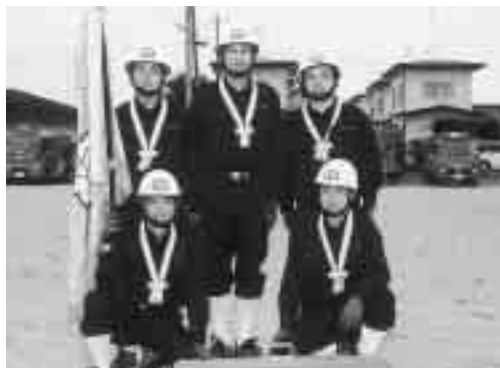
小型ポンプの部優勝の第6分団