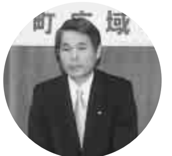
質問に答える木賊町長

市町村合併 方向性は年内に 今回の懇談会を通して、多くのみなさんから「合併するか・しないのか」の判断時期や、合併するとした場合の「梓組み」等具体的な質問が多く寄せられました。この質問に町長からこれ