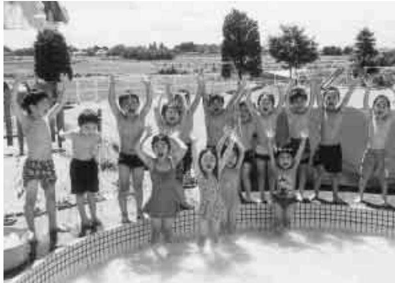
貴重な水で、暑い夏もプール遊びが楽しめます(写真：鏡石保育所のプール遊び)