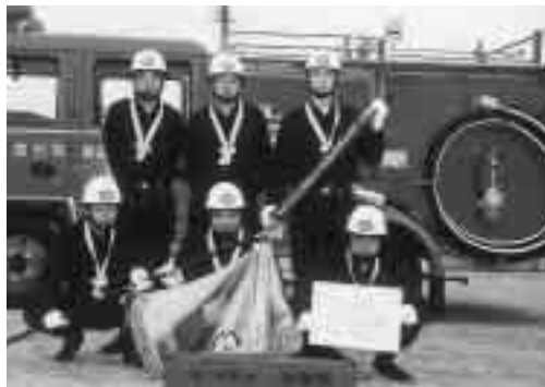
自動車ポンプの部優勝の第5分団