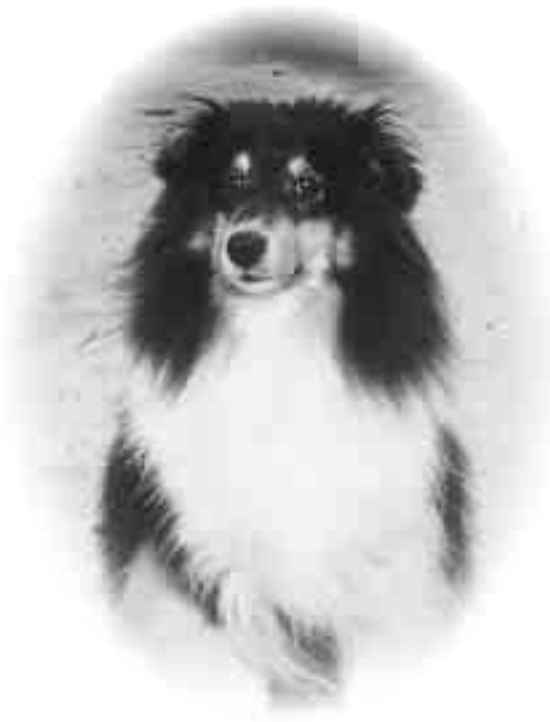
わたしも家族の一員です

県では、毎年約5千頭の犬や猫が「もらい手が見つからず飼えない」等の理由で手放されており、そのほとんどが子犬や子猫です。一部については、飼育を希望する方にお譲りしていますが、大半が安楽死処分されています。ペットは生き物です。次のことに気をつけて、最後まで愛情をもって飼いましょう。