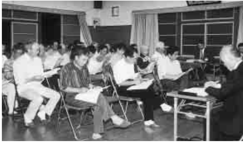
配布資料に目を通し説明を聞く参加者

市町村合併特例法の適用期限が平成17年3月末に迫り、現在市町村合併がテレビや新聞等で多く取り上げられています。町では、この市町村合併について理解を深め、鏡石町の将来をみんなで考える機会として、6月16日から7月3日までの13日間、全行政区において、広域行政に関する町民懇談会を開催しました。今月号では、懇談会の概要を要約して報告します。