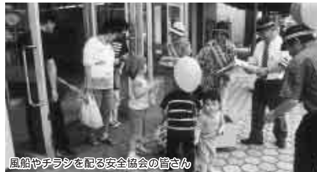
風船やチラシを配る安全協会の皆さん

また、7月25日(金)、早朝から、役場前交差点でシートベルト着用実態調査を行い、併せて運転中のドライバーにシートベルト着用を呼びかけました。