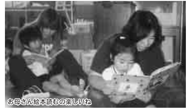
お母さん絵本読むの楽しいね

絵本に親しめる環境を園児達が楽しく絵本に親しめる環境をつくるため、昨年度から6回、保護者や町図書館の協力のもと、絵本の読み聞かせ、「図書の補修」や「分類作業」などの図書ボランティアを行っています。絵本の読み聞かせ会では、指人形などを使い工夫を凝らした読み聞かせを行うことにより園児達は絵本に興味を持つようになりました。