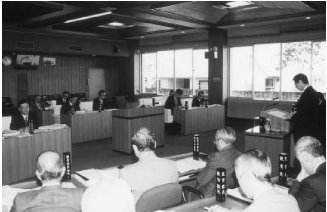
13日間の日程で開かれた9月定例会