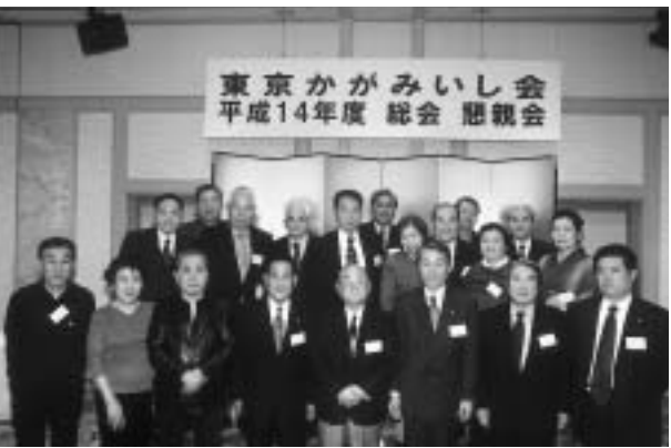
昨年の第20回東京かがみいし会総会

所在地 東京都千代田区麹町6-6 交通 JR四谷駅(麹町口)丸ノ内線、南北線四ツ谷駅より徒歩1分 駐車場は少ないため、電車、バスなどでお越しください。