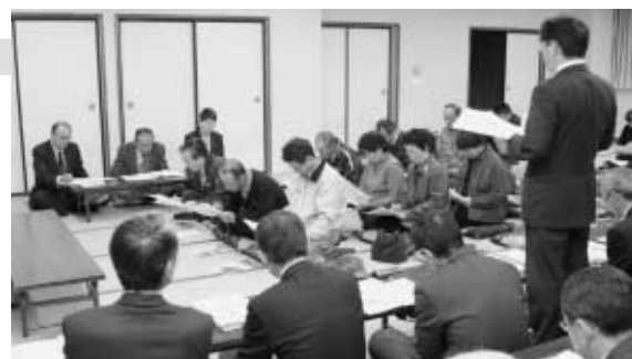
町の説明を聞く町民のみなさん(鏡石2区)

町は11月13日、14日、15日午後7時から鏡石2区、成田区、高久田区の各集会所において町政懇談会を開催しました。参加した各行政区の皆さんは、町に対して日ごろ疑問に思っていることや分からないことを熱心に質問して町の在り方について理解を深めました。