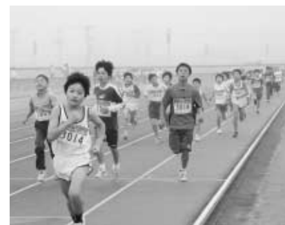
小学生も元気に快走