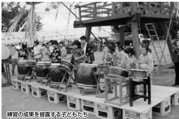
練習の成果を披露する子どもたち