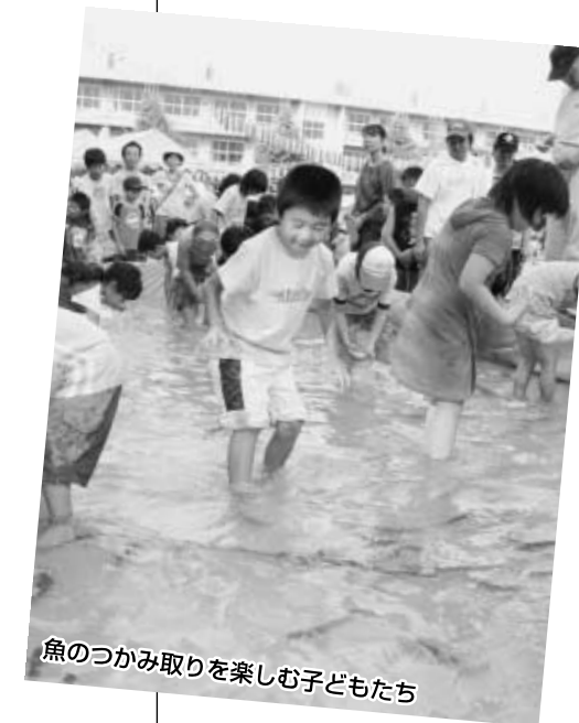
魚のつかみ取りを楽しむ子どもたち