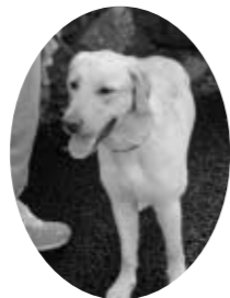
よろしくたのむワン!

犬の飼い主のみなさん、犬の散歩の際は、ビニール袋を必ず持参し、フンは責任をもって処分しましょう。公共のみ箱等へは絶対に捨てないでください。 また、放し飼いをせず、常に飼育場所は清潔にするなど心がけてください。