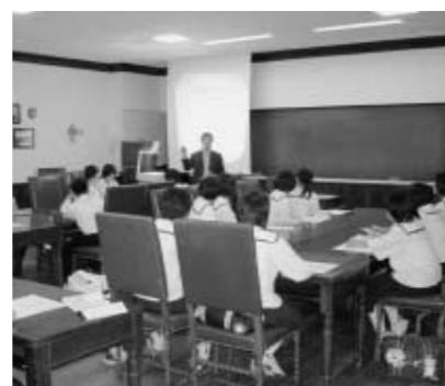
事前研修する団員

各団員のみなさんは、英会話など4回の事前研修を経て、カナダに出発し、カナディア・ンロッキーなどカナダの大自然を満喫するほか、ホームステイを行い、日本との生活文化の違いを直接肌で体験します。