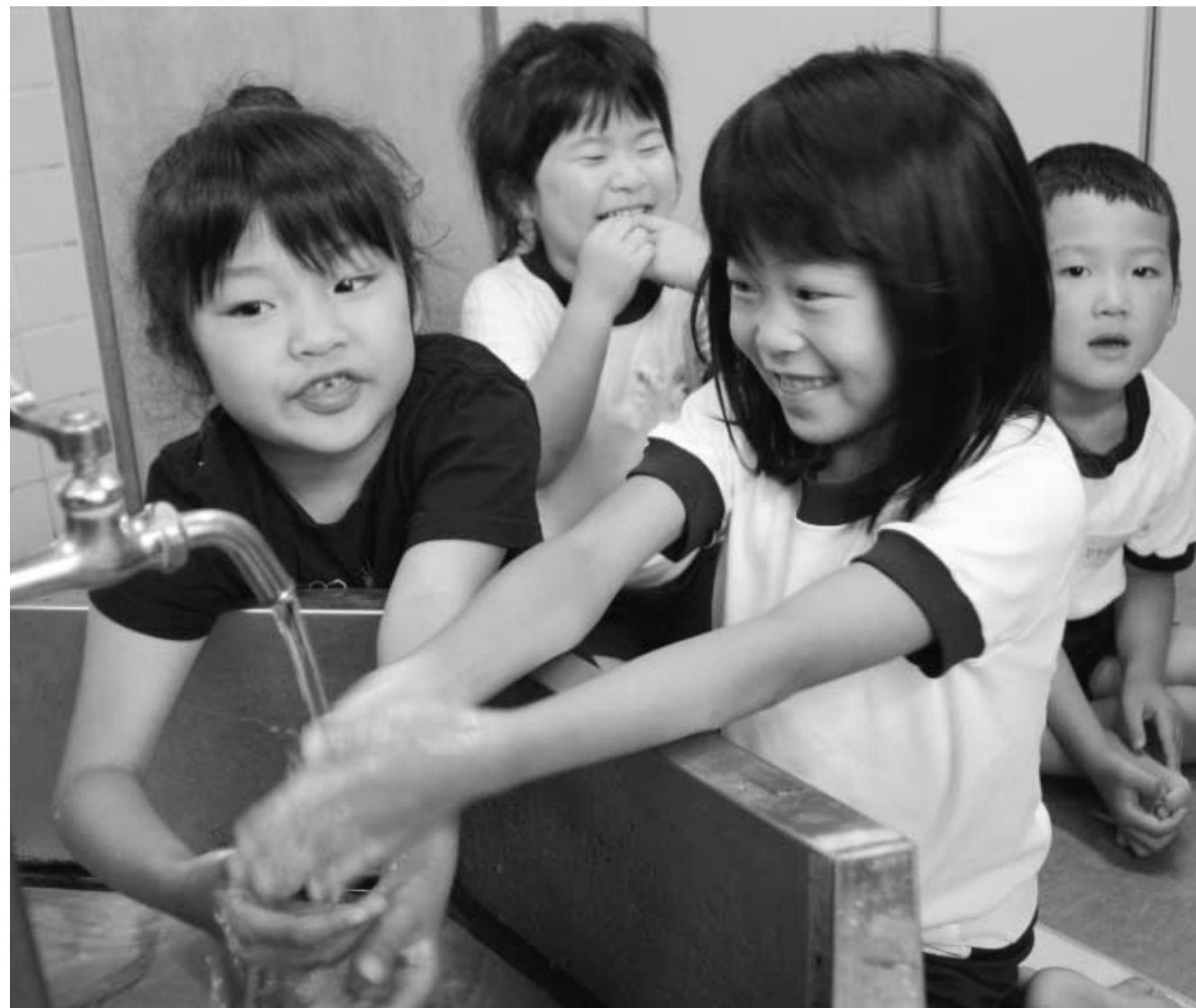
水は私たちの生活になくてはならないものです