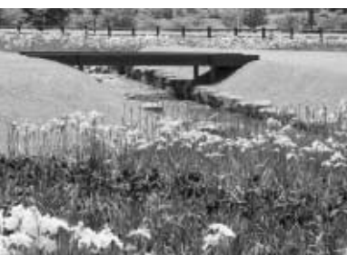
鳥見山公園内では、6月下旬に あやめ祭りを開催