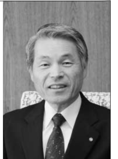
平成20年度町長所信表明

第4回町議会定例会が開催され、平成20年度一般会計予算を含める37議案が審議され、原案のとおり可決されました。ここでは、どんな事業を行い、どんなお金の使われ方をするのか、一般会計予算を中心にお知らせします。