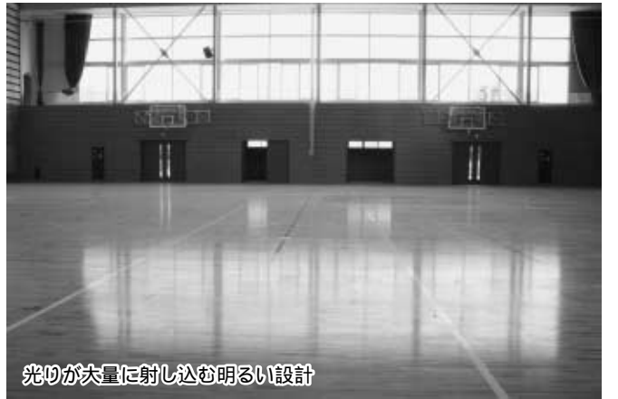
光りが大量に射し込む明るい設計