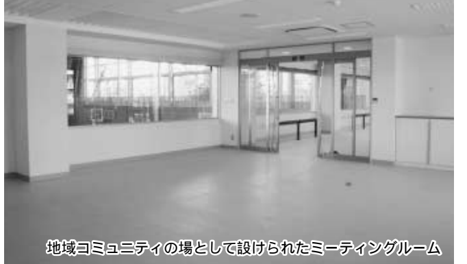
地域コミュニティの場として設けられたミーティングルーム