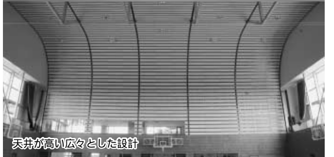
天井が高い広々とした設計