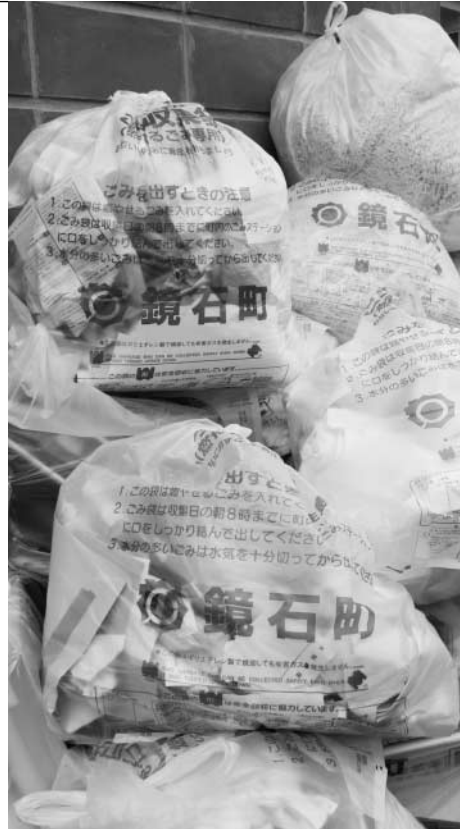
燃えるごみは火・金曜日

皆さんの家庭から出るごみは、収集日や収集場所が決まっています。ごみは、燃えるごみ、燃えないごみなどに分類されています。ごみを出すときは、ルールを守りましょう。生ごみは、きちんと水切りをしてから捨てましょう。また、6月は、不法投棄防止強調月間です。町内には、不法投棄が目立つところがあります。不法に投棄されたものを撤去するのにも、みなさんの税金が使われます。不法投棄は、「しない」、「させない」、「許さない」地域づくりにご協力ください。 問い合わせ先 町健康福祉課 ☎ 62 21115