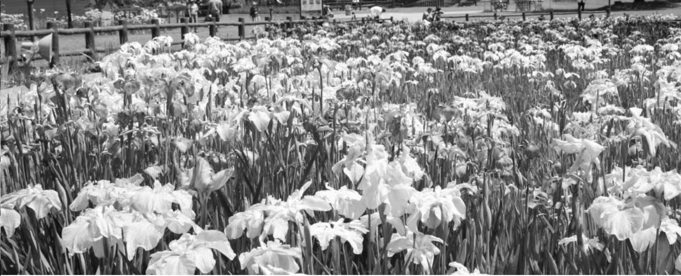
美しいあやめの花が咲き誇るあやめ園