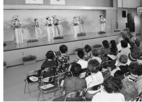
体育館では文化芸能祭を開催 第4回あやめ祭りから

町では、6月17日(日)から24日(日)までの8日間、第5回鏡石あやめ祭りを開催いたします。会場となる鳥見山公園では、祭りが開催される6月下旬ともなると、4万株の色とりどりの美しい「あやめ」が咲き競います。祭りの期間中は、あやめ撮影会や文化芸能祭、あやめ