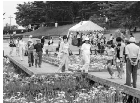
多くの来場者でにぎわう会場 第4回あやめ祭りから