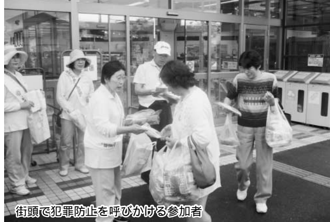
街頭で犯罪防止を呼びかける参加者

当日は、350人の方が朝のすがすがしい空気を味わいながら、鏡石町公民館を出発し、岩瀬農業高校までの片道約2キロの道のりを歩きました。参加者は岩瀬農業高校のミルクたっぷりのアイスクリームの味を堪能しました。