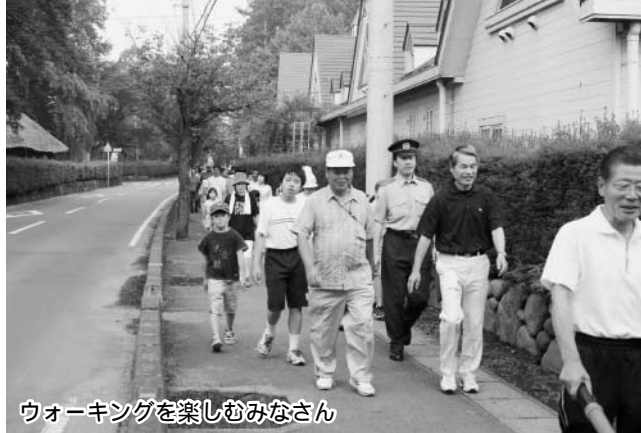
ウォーキングを楽しむみなさん