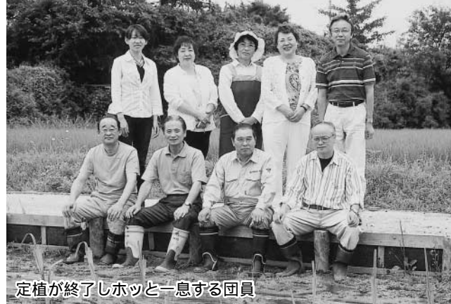
定植が終了しホッと一息する団員

今回の運動は、「犯罪・非行の防止と更生の援助のため、地域住民の理解と参加を求める」を重点目標に掲げ実施されました。保護司、更生保護女性会、民生児童委員など50名が参加し、運動を展開しました。