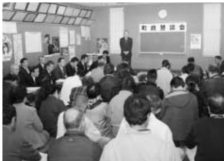
町政懇談会(鏡石3区、久来石区、豊郷区)

町民みなさんの声を聴き、町の将来の在り方を探る目的とした町政懇談会が、11月8日から12日までの3日間、鏡石3区、久来石区、豊郷区の3行政区で開催されました。3行政区では、合計89人の方が出席し、延べ51件の質問や意見が出されました。質問の主な内容は、建設・土木に関するものが21件、衛生・福祉に関するものが8件となりました。 町では、みなさんからの意見や要望をこれからの町政に活かしていくこととなります。