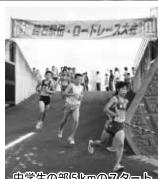
中学生の部5kmのスタート

11月4日(日)鳥見山陸上競技場を会場に、第3回鏡石駅伝・ロードレース大会が開催されました。 秋晴れの中、県内外から1,102人のランナーが参加し、ロードレースの部13部門、駅伝の部5区間で競技が行われました。親子の部では、子どもに手を引かれる父親の姿も見られました。 今年は、最小年齢が3歳、最高年齢が71歳、遠くは秋田県秋田市から参加者がありました。