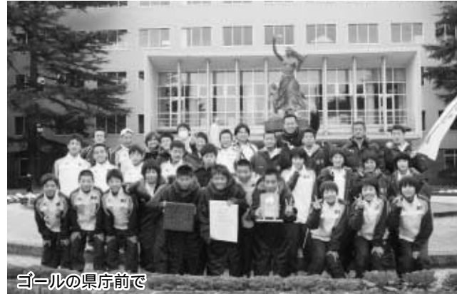
ゴールの県庁前で