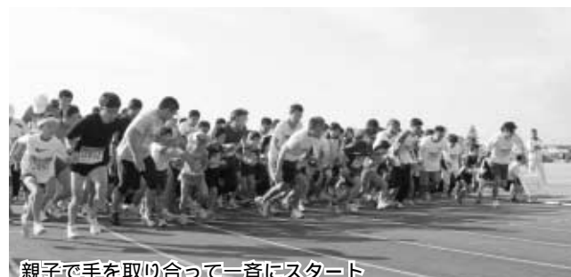
親子で手を取り合って一斉にスタート