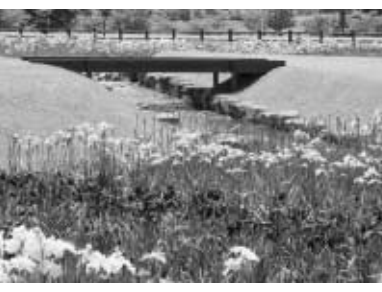
鳥見山公園内では、6月下旬に あやめ祭りを開催