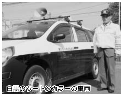
白黒のツートンカラーの車両